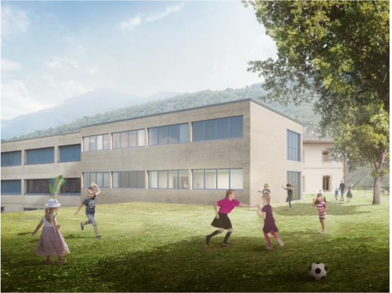
Nuova ala vista dal giardino dell'ex asilo