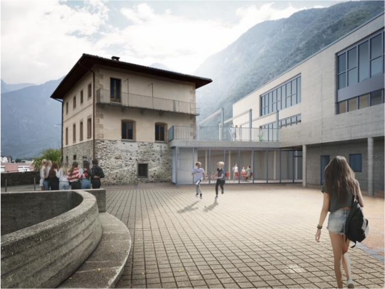
Nuova ala e sala multiuso vista dal piazzale scolastico