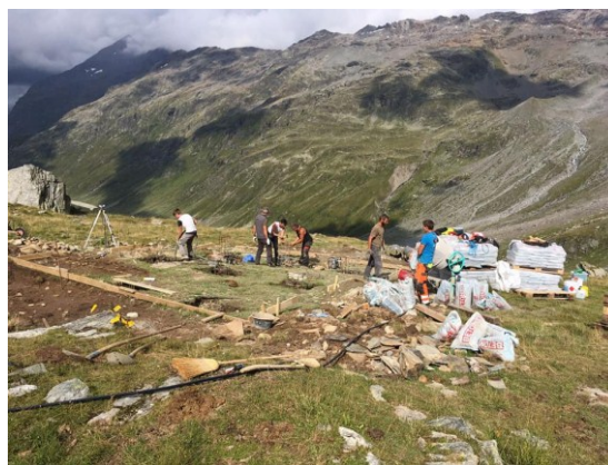
Cantiere 2018 – scavo delle fondamenta

Durante l'estate 2018, grazie agli attivi, sono stati posati i basamenti in cemento e la struttura in acciaio che sosterrà la struttura in legno, che si vorrebbe ultimata entro l'inverno 2019.