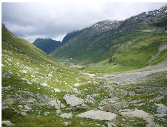
Alta Val Curciusa

In questo frangente, per permettere agli escursionisti di percorrere questa splendida nuova via alta dalle viste imperdibili e dagli ambienti alpini selvaggi, l'associazione sta costruendo un nuovo rifugio a 2400mslm.