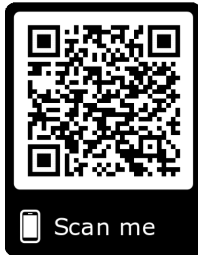
QR-Code da scansionare per dispositivi mobili

Conto corrente bancario per versamenti senza piattaforma crowdfunding